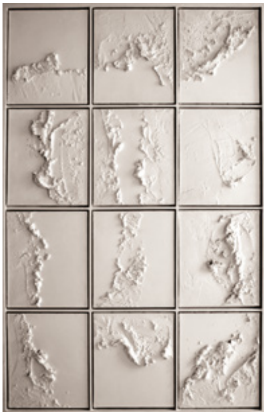
«Archipel 2 », Technique mixte sur toiles tendues, 12 pièces permutables, 178 x 108 cm. 1998.

« La peinture en archipel », par Eric Marty