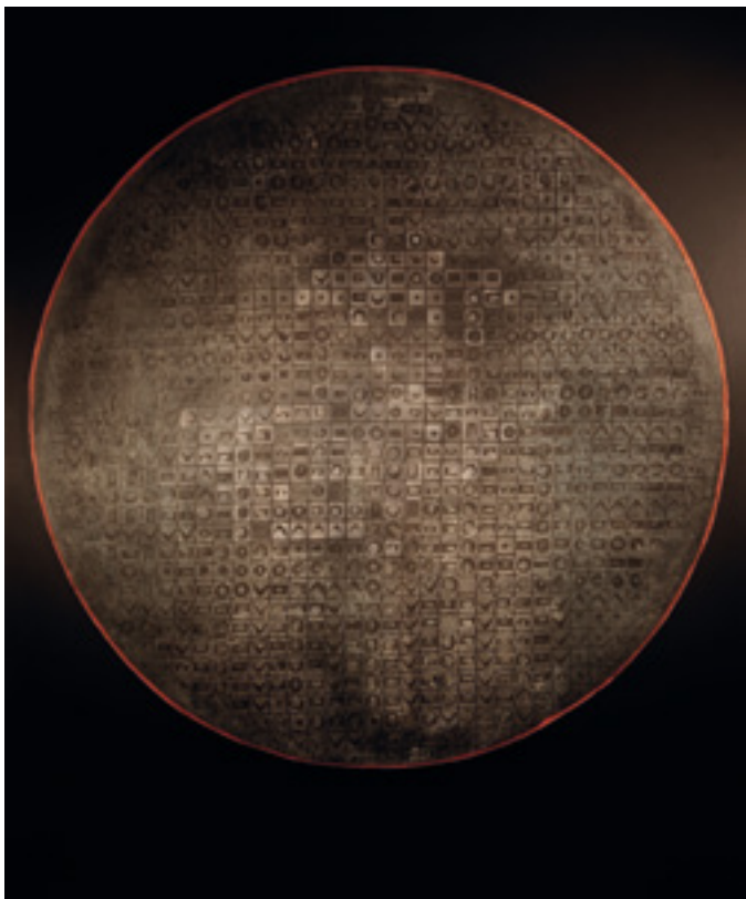
« Indéchiffrables 3 : Disque noir cerclé de rouge » Acrylique sur toile tendue, 175 x 145 cm, 1993.

Fondées sur de véritables textes (poèmes, récits, haïkus) mais dont l'inscription se trouve transposée dans un code qui les rend littéralement inintelligibles, ces œuvres reposent sur un cryptage qui oblige le regardeur à s'installer dans une relation de lisibilité empêchée .