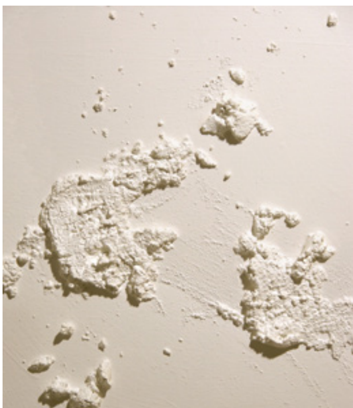
«Archipel 5 (détail) », Technique mixte sur toiles tendues, 6 pièces permutable, 90 x 108 cm. 2018.

Chromatiquement réduits à une seule couleur (un blanc pur qui combine toutes les couleurs du spectre solaire) et aux concepts de vide et d'intervalle, les Archipel associent une présence discrète de la matière brute (le mortier de sable) dispersée aléatoirement sur chaque toile-unité, la structure orthogonale de la grille (qui permet le rangement de 12 toiles-unités et leur lecture comme ensemble), et le principe d'une combinaison aléatoire de toutes ces toiles-unités qui sont physiquement permutable.