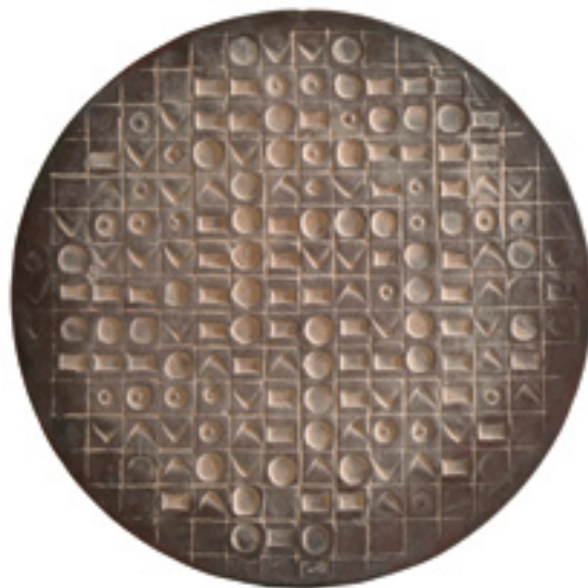
« L'Empire du signe XIII, Matrice ES 13 pour aquagravure ». Technique mixte et poussière de Massada sur bois, diamètre 60 cm. 2017

Pierre-Marc De Biasi explore depuis longtemps la confrontation entre le dispositif circulaire du tondo, la structure orthogonale des grilles porteuses de ses codes plastiques et la matière minérale dans laquelle il imprime les formes, les couleurs de ses textes cryptés. Réalisée sur toile ou sur panneau de bois ou de métal de grandes ou moyennes dimensions, la mise en œuvre des reliefs commence par un mortier de sable, travaillé au moment où il entre en prise, dans lequel l'artiste forme les signes de son message plastique : un scénario dans lequel il s'agit pour l'artiste de retrouver les gestes du scribe sumérien, il y a cinq mille ans, quand il enfonçait ses sceaux et son stylet dans l'argile pour écrire, en pictographique ou en cunéiforme, les premiers textes qui allaient faire entrer la civilisation dans l'Histoire.