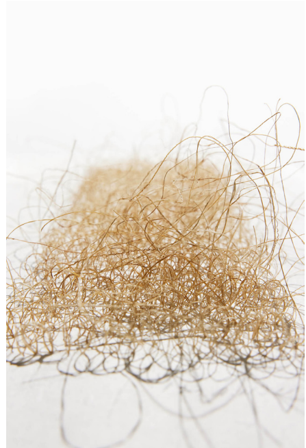
Écriture II, fil de chanvre sur papier HANJI, 23 x 50 cm, 2023 © Benjamin Etchegaray