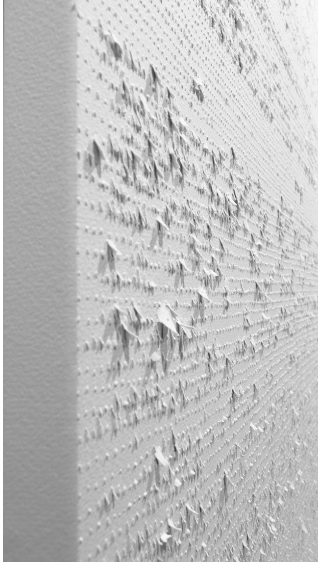
Écriture blanche III, écriture et perforations sur papier arche tendu sur toile, 97 x 194 cm, 2018

Il y a d'abord ces espaces blancs que l'on approche avec attention, avec précaution, avec le respect que l'on témoigne à ce qui recèle un mystère délicat. Là s'énonce un langage. Discret, il effleure le silence puis la surface immaculée du papier et se murmure en nuances.