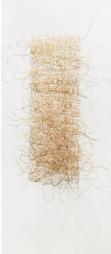
Écriture II, fil de chanvre sur papier HANJI, 23 x 50 cm, 2023 © Benjamin Etchegaray