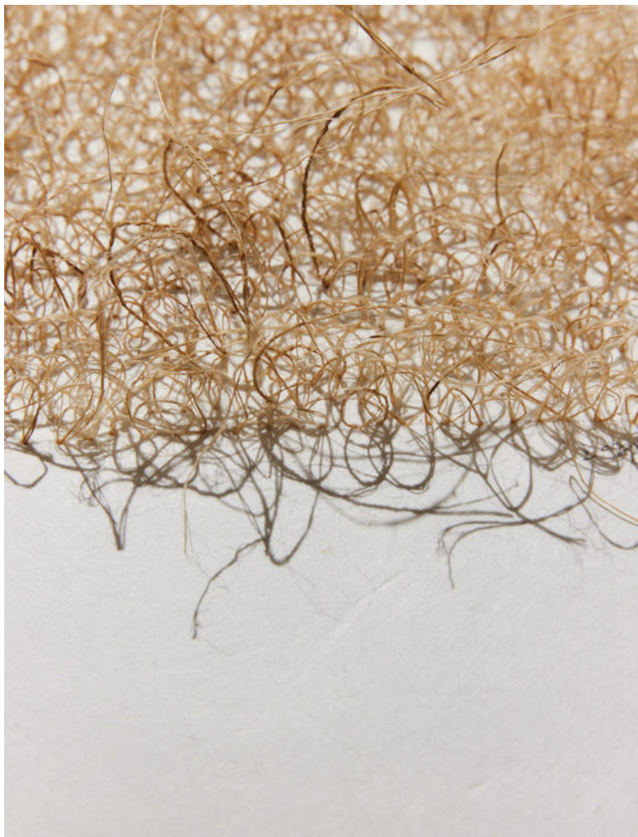
Écriture, fils de chanvre sur du papier HANJI, 23 x 50 cm, 2023

La galerie présente KIM Myoung Nam. Artiste coréenne, elle vit et travaille à Paris. Elle expose régulièrement en Corée du Sud, en Grèce, au Japon et en Chine, en galerie et dans des musées. Son oeuvre fait partie des collections publiques. Elle enseigne à l'école des Beaux-arts de Versailles.