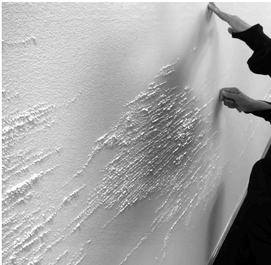
Écriture blanche (détail), perforations sur papier Arches tendu sur toile, 350 × 100 cm, 2020-2022

Grèce : Ambassade de la République de Corée en Grèce