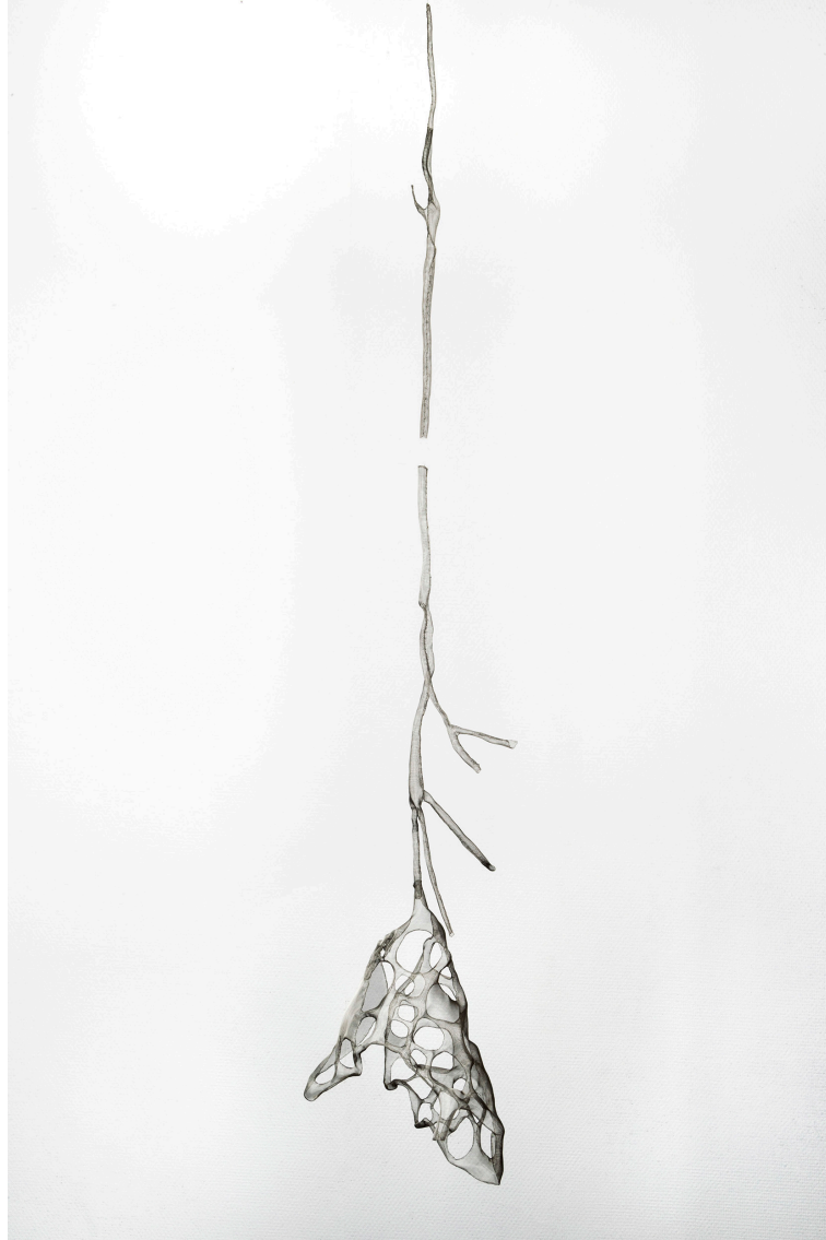
Nature fantôme, 2024 -120 x 35 x 35 cm, gaze d'acier inoxydable