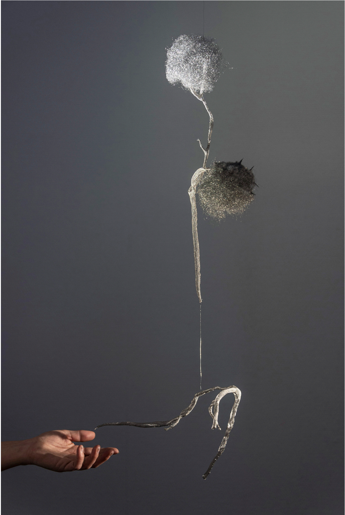
Anne Laval, Nature Fantôme, 2024, 40 x 60 x 25 cm, gaze et laine d'acier inoxydable