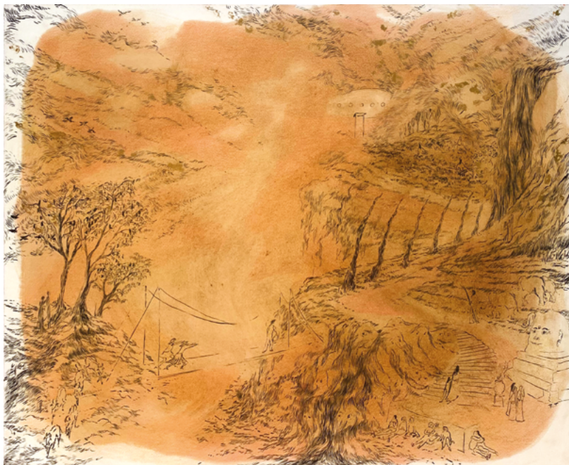
Le passage, 2019. Encre et crayon sur papier 87 x 66 cm.

Le monde de Rada Tzankova est favorable aux êtres humains, même s'ils sont rares, et parfois au bord de la disparition. Le corps de passage est éphémère chemin d'univers, et seules les traces perdurent. D'une étonnante proximité formelle, les humains, les arbres et les rochers fraternisent, tant leur réduction graphique aux signes basiques, précaires et toniques, voire telluriques, les rapproche. Plastiquement, le trait d'humanité ne s'éloigne pas de celui de l'arbre ou de la roche. Le graphisme qui les fait vivre est quasiment le même, alphabet minuscule né de points quasi microscopiques le plus souvent identiques, comme des notes sur les cinq lignes d'une portée musicale mouvante et modulable.