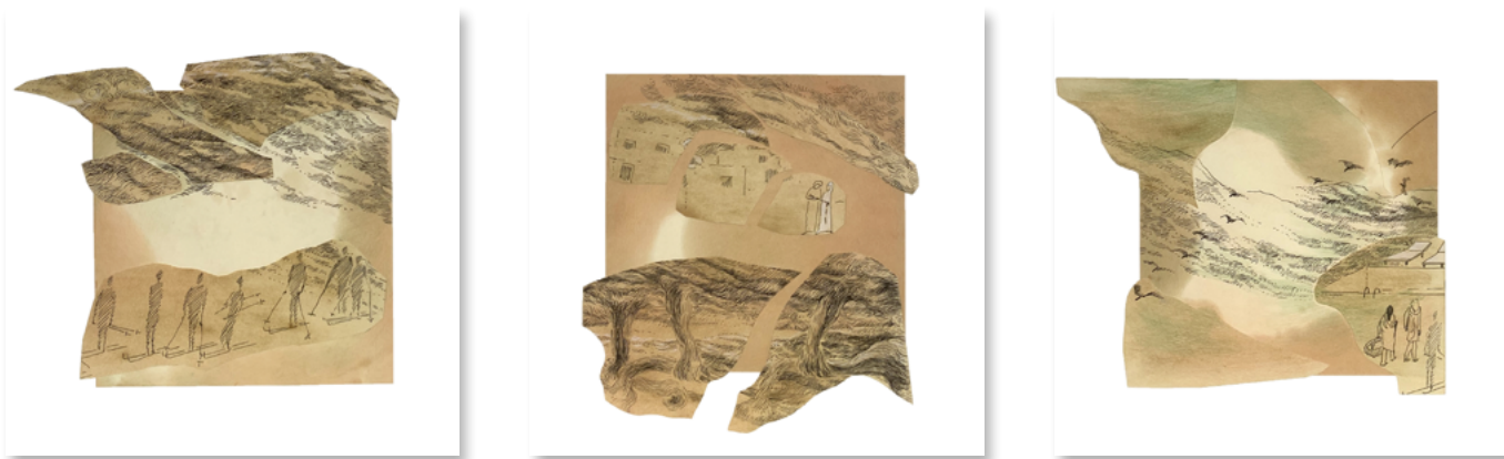
Série journal, 2018. Encre de chine et aquarelle sur papier découpé, 16 x