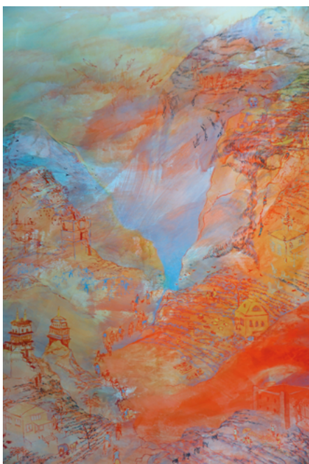
Big Boudha, 2024. Gouache, pigments, encre de Chine sur papier, 190 x 150 cm.