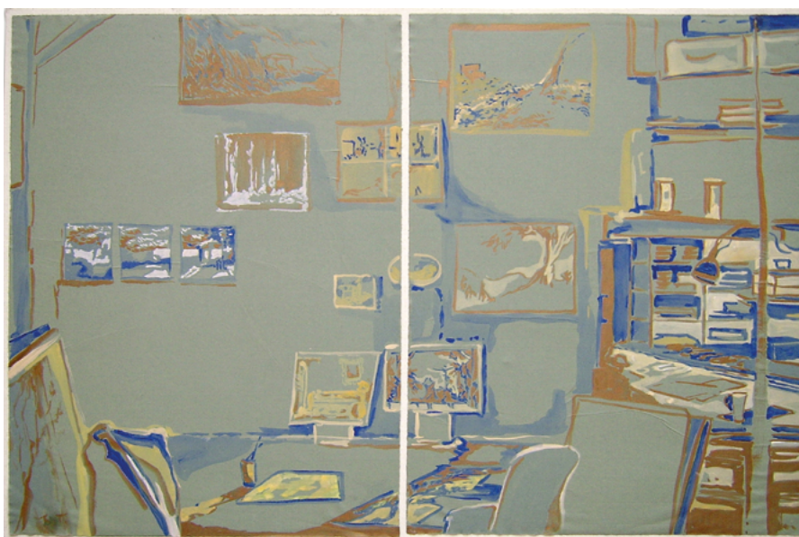
L'atelier, 2013. Acrylique sur papier marouflé sur toile, 70 x 110 cm.

Passée l'Afrique, l'Asie joue chez Rada Tzankova un rôle majeur, tant du côté de la poésie