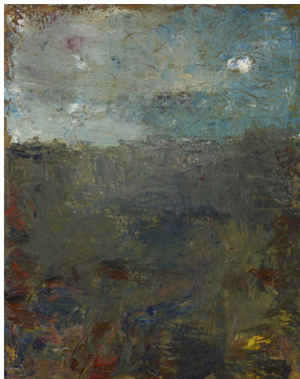
Paysage, 2023. Huile sur toile, 92 x 73 cm. ©Bertrand Hugues

De même, chez lui, l'œil cherchait en vain une anecdote ou un site familier. Pas topographique pour un sou, ses sous-bois ou ses forêts étaient – comment dire ? – contrariés. On sentait confusément que ce que l'on voyait n'était que le dessus de l'iceberg, que cette représentation de la nature ne constituait qu'une strate qui en cachait d'autres. Parfois un bâton en bois ajouté sur la surface, un trou percé dans la toile ou un format inhabituel venait troubler toute tentation d'une vision rassurante, d'un cliché qui avait fait ses preuves. »