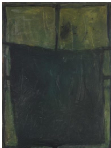
Rideau devant une fenêtre au reflet vert, 2011. Huile sur toile, 130 x 97 cm.