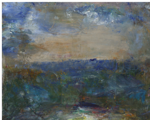
2021/24 – Paysage, 2021. Acrylique sur toile, 46 x 55 cm.