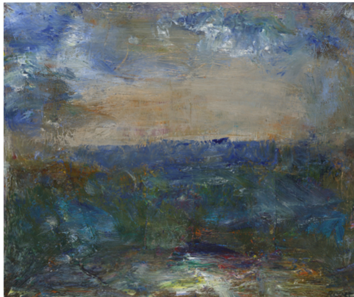
2021/24 – Paysage, 2021. Acrylique sur toile, 46 x 55 cm. ©Bertrand Hugues

A partir du 18 janvier 2024, la galerie Univer présentera les œuvres les plus récentes de Marc Ronet, peintures, dessins et gravures. Le travail de Marc Ronet est présenté tous les deux ans depuis 2010 en exposition solo à la galerie. Son travail sera également exposé du 8 au 11 février 2024 à ArtUp Lille.