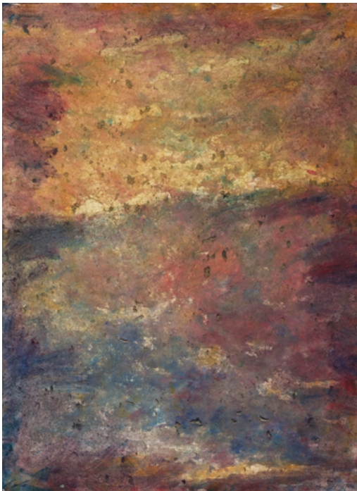
Paysage, 2022. Acrylique sur papier, 76 x 56 cm. ©Bertand Hugues