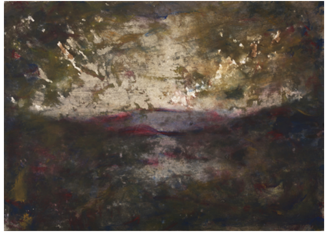
Paysage, 2022. Acrylique sur papier, 56 x 76 cm. ©Bertand Hugues