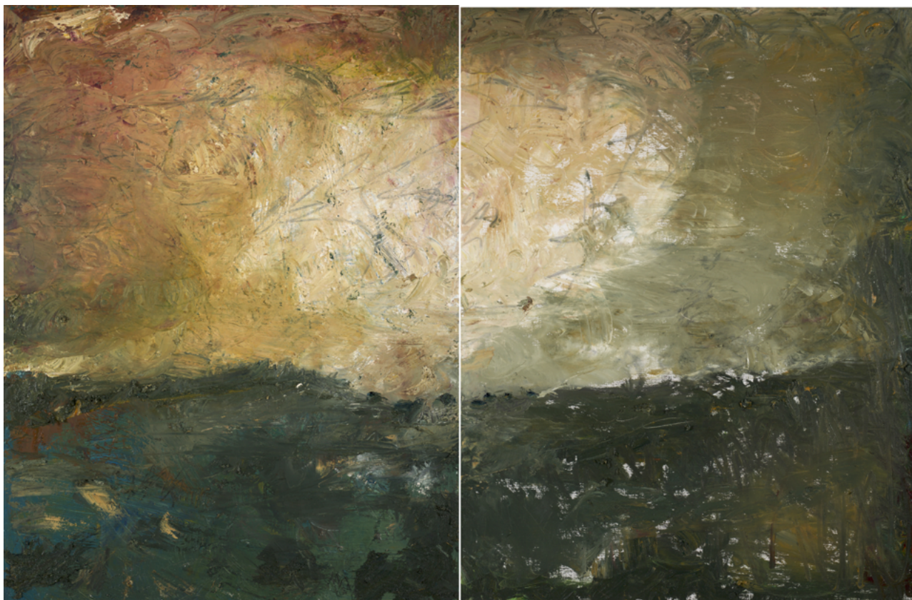
2023/6 – Ciel et sol en mouvement (diptyque), 2023. Huile sur toile, 116 x 178 cm. ©Bertrand Hugues