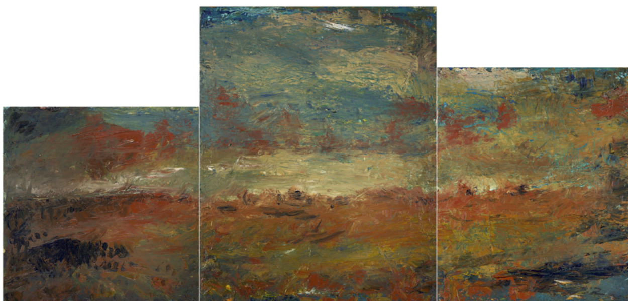
Triptyque Paysage, 2023. Huile sur toiles, 92 x 193 cm. ©Bertand Hugues