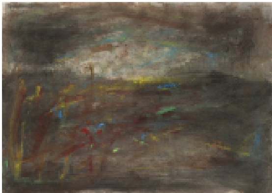
Paysage, 2013. Technique mixte sur papier. @ François Pons