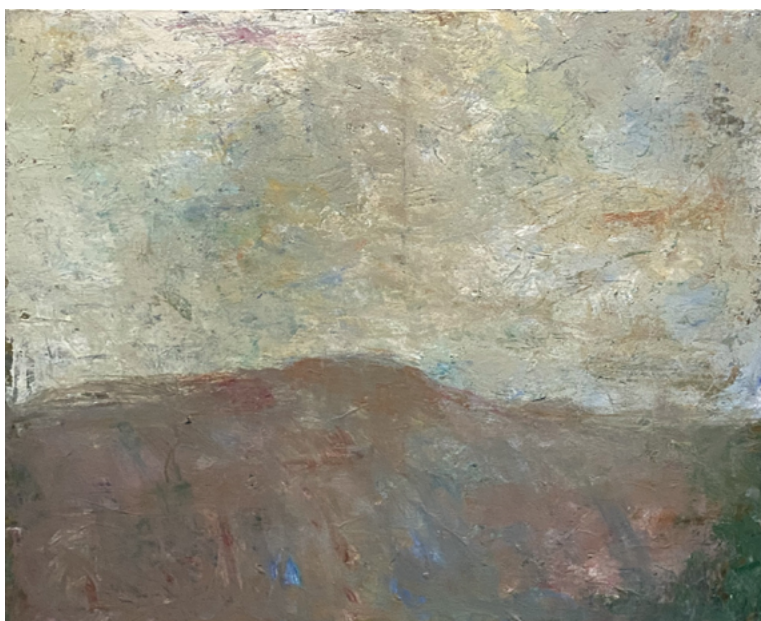
2022/10 Paysage, 2022 . Acrylique sur toile, 81 x 100 cm