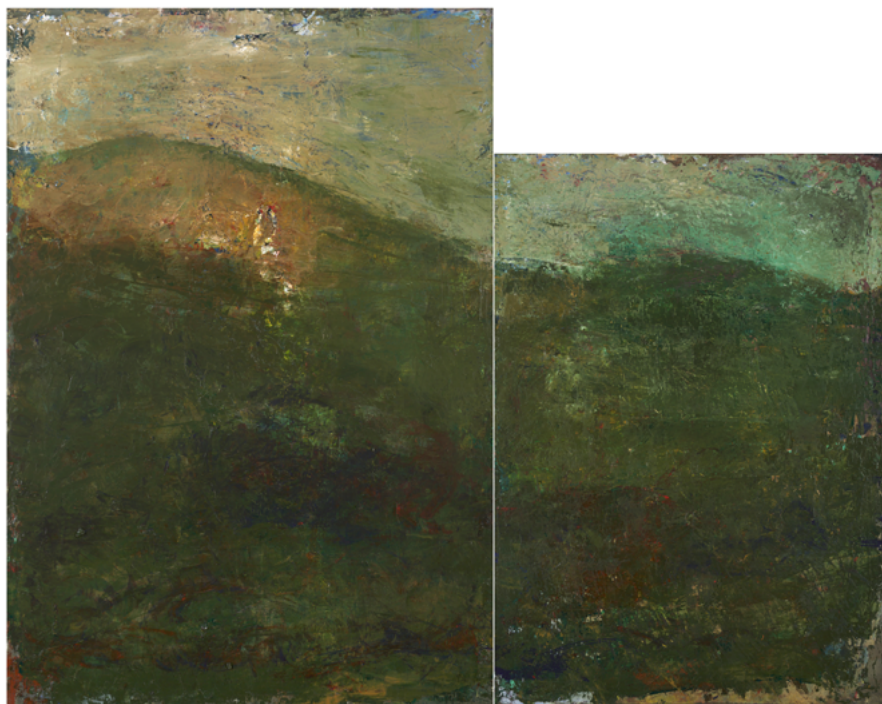
2022/7 – Paysage (diptyque), 2022. Huile sur toile, 116 x 146 cm. ©Bertand Hugues