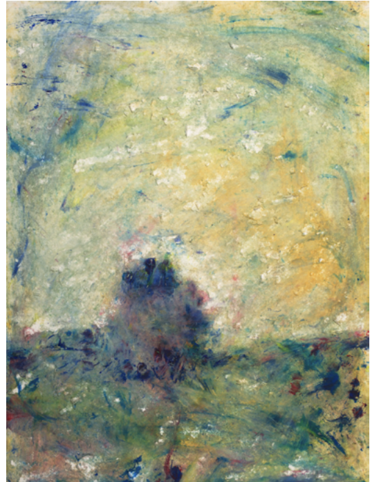
Paysage, 2022. Acrylique sur papier, 76 x 56 cm. ©Bertand Hugues