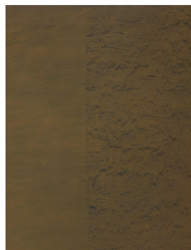
Sans titre, 2023. Huile sur papier, marouflé sur toile, 65 x 50 cm.