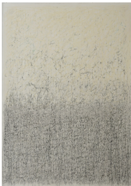
Sans titre, 2022. Crayon de couleur sur papier, 42 x 30 cm.

Cette deuxième exposition personnelle consacrée à Philippe Fontaine sera l'occasion de découvrir les dernières peintures à l'huile et dessins au crayon de couleur. Son travail tient de la modestie, de la discrétion, de la lenteur. Il surprend par la profondeur et une forme d'intimité qui surgit d'une forme simple, qui à première vue pourrait s'apparenter à un à-plat de couleur en demi-teinte, et pourtant qui contient tant de nuances indicibles. Chacune de ses œuvres renvoie une vibration qui lui est particulière et avec si peu il parvient à l'essentiel.