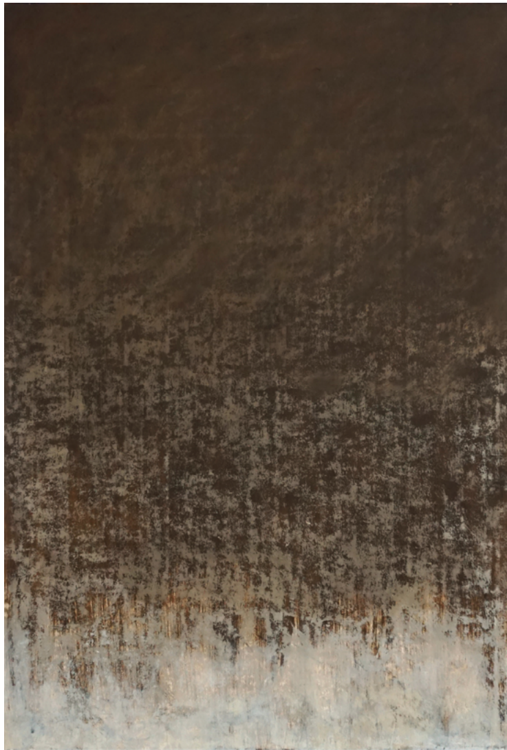
Sans titre, 2023. Huile sur papier marouflé sur toile, 110 x 75 cm.