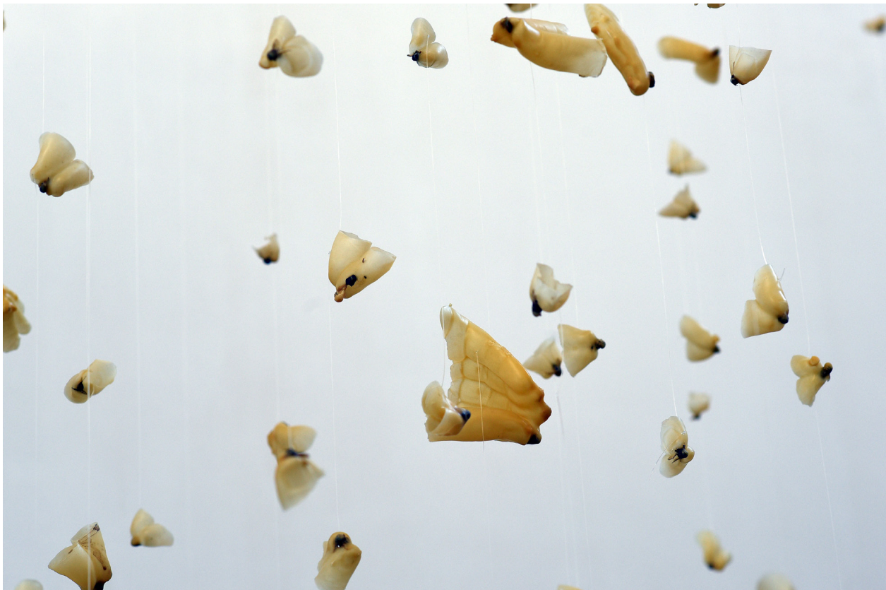
Toucher ses ailes une dernière fois (abeille), 2019. 255 abeilles, cire d'abeille, dimensions variables