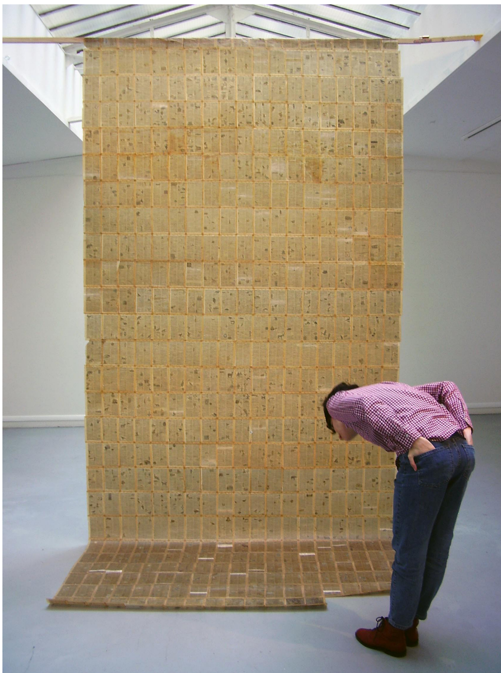
Le dictionnaire amoureux, 2016-17 Dictionnaire ancien (1914), cire d'abeille 390 x 186 cm ©Lena Petit-Doux