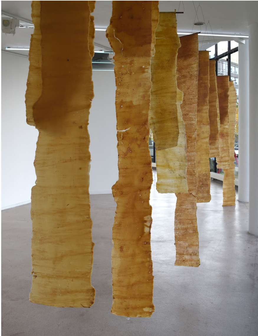
Écorces, 2018-19. Cire d'abeille, poussière d'if, Série de 11 sculptures suspendues de 290 x 30 x 0,1 cm