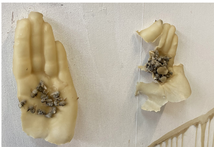
Vue d'atelier, abeilles et cire d'abeille.