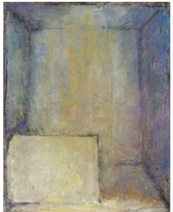
« Forme dans un lieu vide », 2021. Huile sur toile, 100 cm x 81 cm.