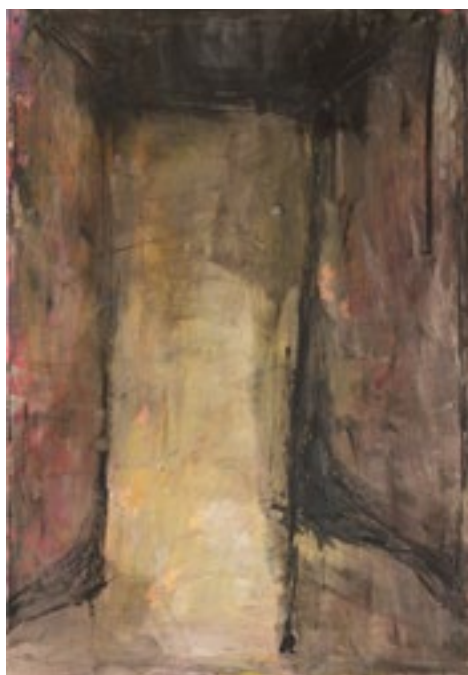
« Lieu ouvert aux murs sombres », 2021. Acrylique sur toile, 130 x 89 cm.