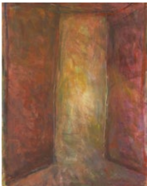
« Lieu ouvert aux murs pourpres », 2021. Acrylique sur toile, 116 x 89 cm.