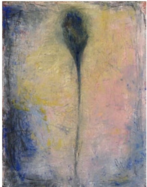
« Grande fleur bleue », 2020.

Huile sur toile et tissu collé, 100 x 73 cm.