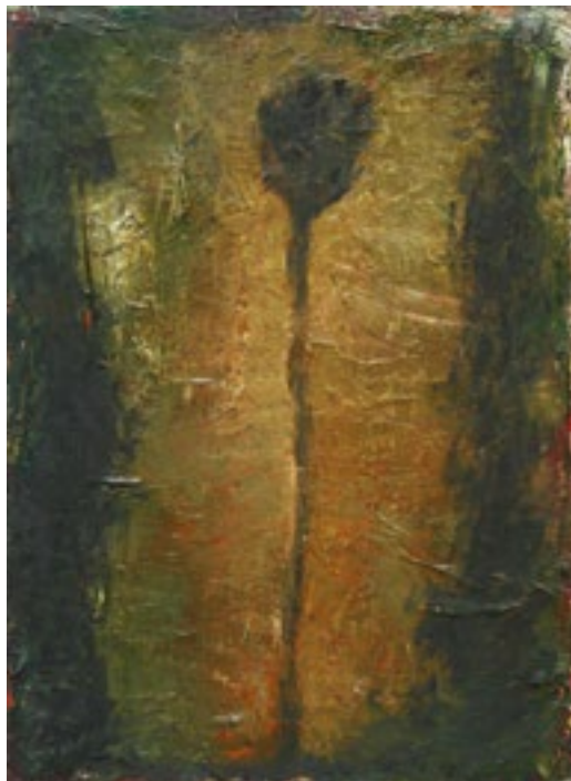
« La belle noire », 2020.

En tant que spectateur, vous vous attendiez à voir une peinture bien établie, définitive! Ca l'est en partie. Vous vous doutez bien que j'ai d'autres «chapitres» à ajouter à mon «livre»; certains assez longs, d'autres plus courts. On y trouve des certitudes mais pourquoi les questions continuent-elles d'affluer?