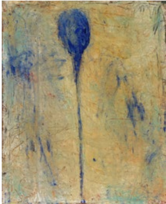
« Fond clair et fleur bleue », 2020. Huile sur toile et tissu collé, 100 x 81 cm.

Aucun sujet n'est plus difficile pour un peintre que des fleurs. Rien, en effet, ne se prête plus facilement au kitsch, à la mièvrerie. Les coquelicots de Monet qui reviennent systématiquement sur d'innombrables bonbonnières et autres bibelots ont définitivement scellé le destin de ce composant du monde végétal.