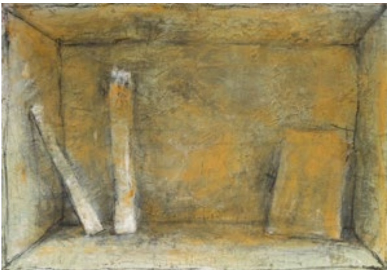
« Bâtons dans un lieu ocre », 2020. Acrylique et pigment sur toile, 81 x 116 cm.