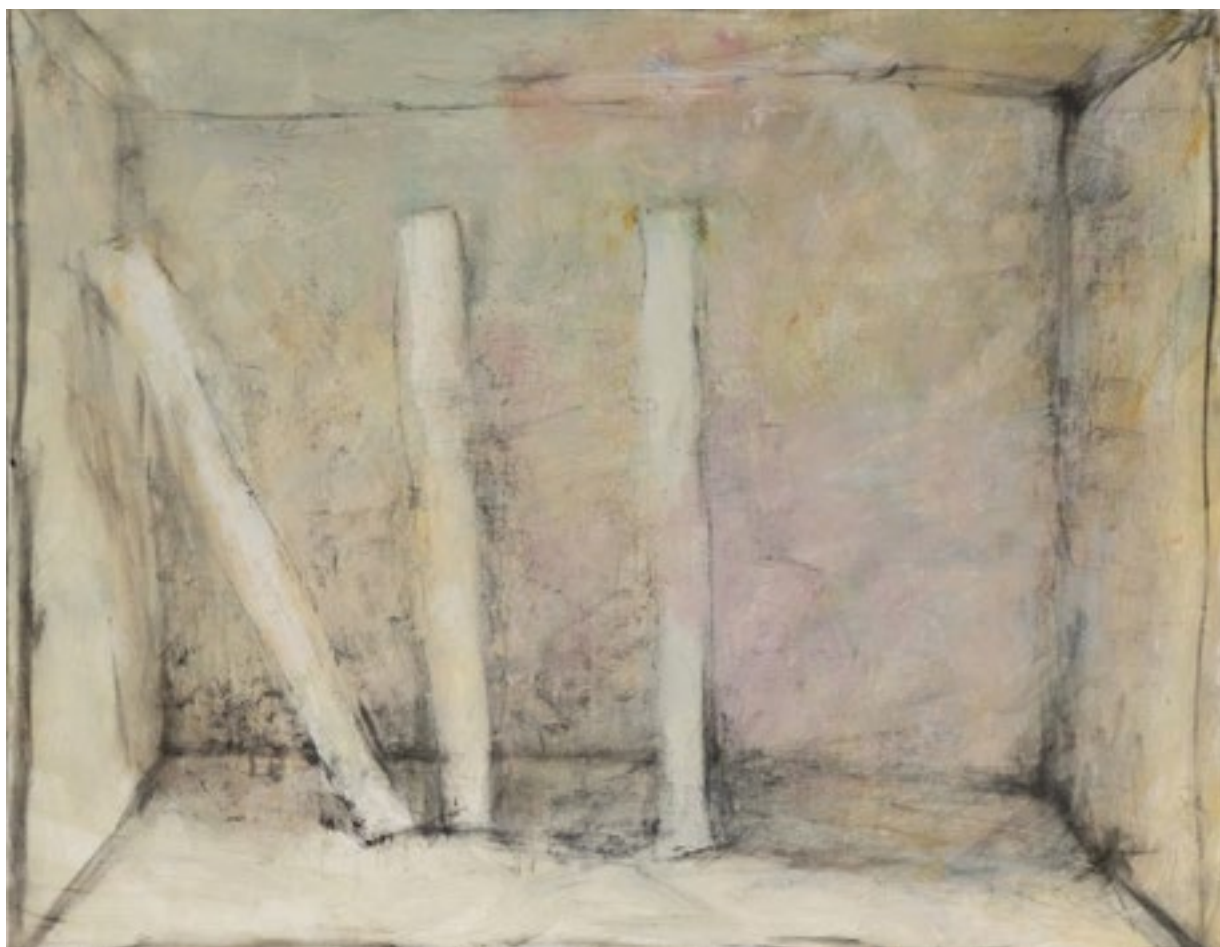
« 3 Bâtons dans un Lieu », 2020. Huile sur toile, 81 x 100 cm.