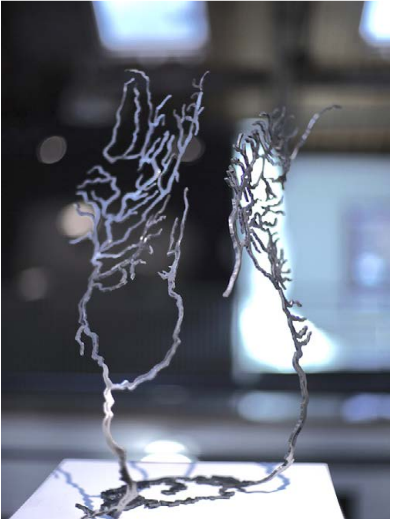
« Mer d'Aral », acier de 3mm verni, 45 x 24 x 35 cm, 2018.