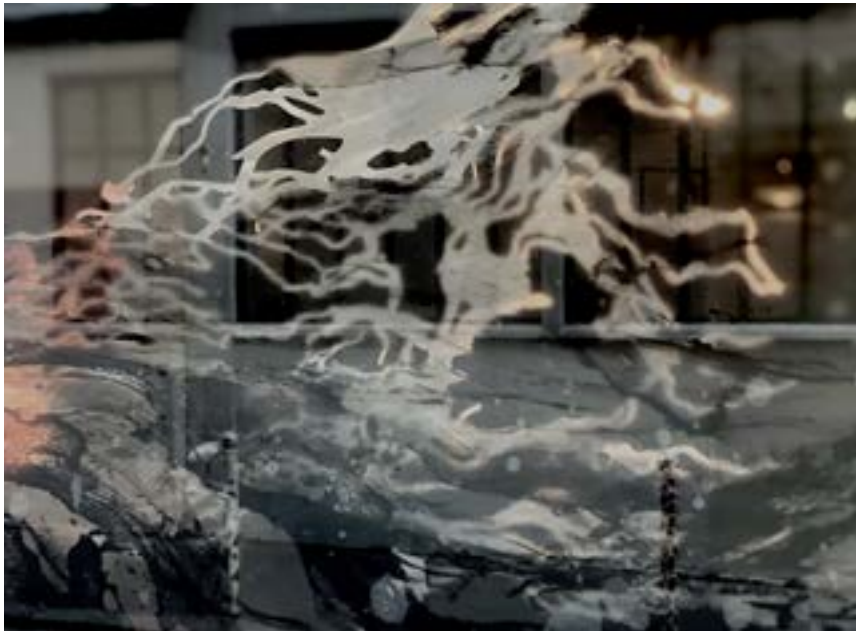
« Cascade » Installation Galerie Univer, vitrophanies et inox, 2020