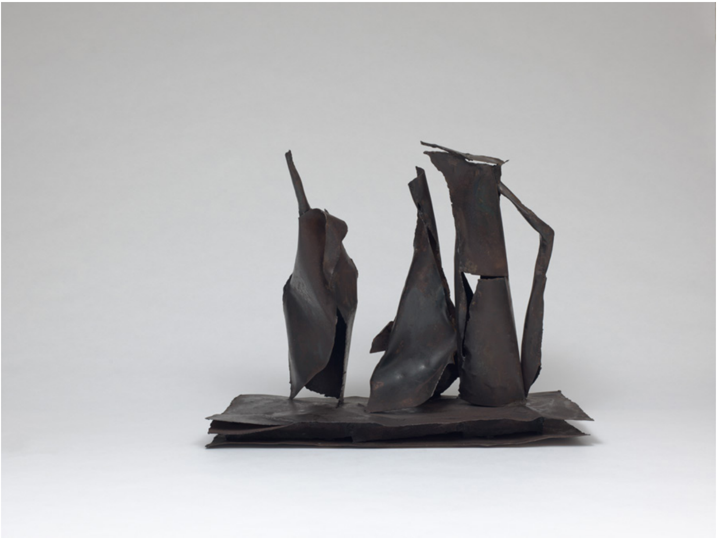
« Composition pots et bouteille » sculpture, 66 x 51 x 25 cm, 2017/18. ©Nicolas Pfeiffer