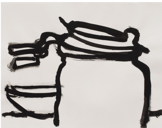
Dessin, 35.5 x 28 cm, 2018