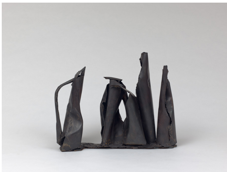
«Pots et bouteille alignés», sculpture, 48 x 40 x 23 cm, 2017/18.