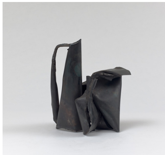
« Carafe pot et pichet », 22 x 31 x 21 cm, 2018.