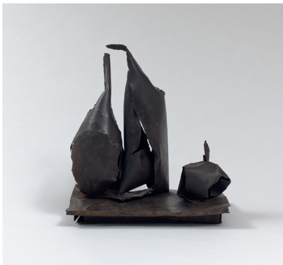
« Composition 2 pots un fruit », 46 X 50 X 30 cm, 2018.