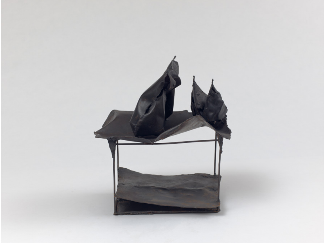
« Composition aux poires », 37 x 31 x 20 cm, 2019.