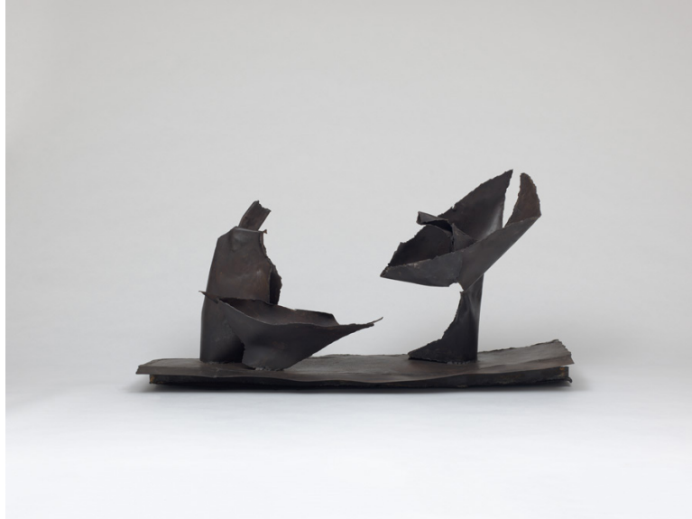
« Composition 3 éléments, coupe poire et bouteille », sculpture, 88 X 40 X 26 cm, 2017/18.