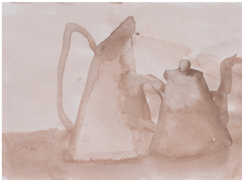
Variations «sepia», dessin, 29 x 42 cm, 2017/18.