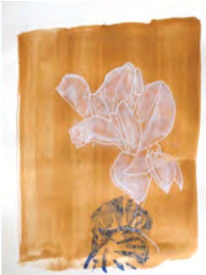
Jean-Michel MEURICE Cyclamen 39 45 x 30cm, 2014