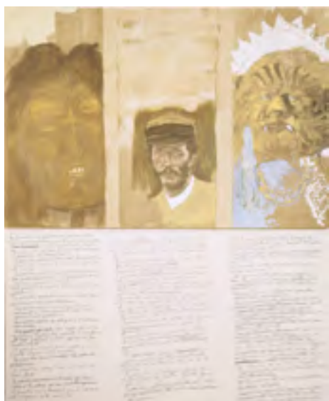
JEAN LE GAC Fiction 7 246 x 200 cm, 1993