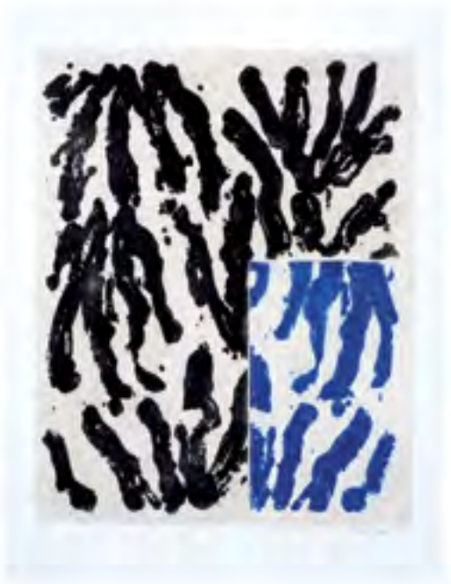
GÉRARD TITUS-CARMEL Viomes & Lichens – Carborundum V 76 x 57 cm, 2013