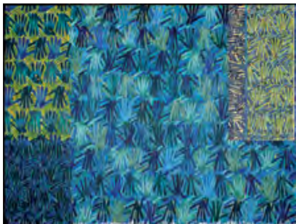
GÉRARD TITUS-CARMEL Brisées - Sur la route de la Soie XIV Acrylique sur toile, 195 x 260 cm, 2009