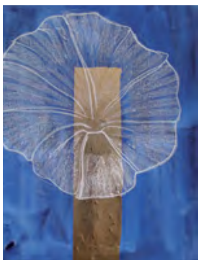
JEAN-MICHEL MEURICE Bartok - Piano bleu 4 Acrylique, polyester et pastel gras sur toile 107 x 77 cm, 2011