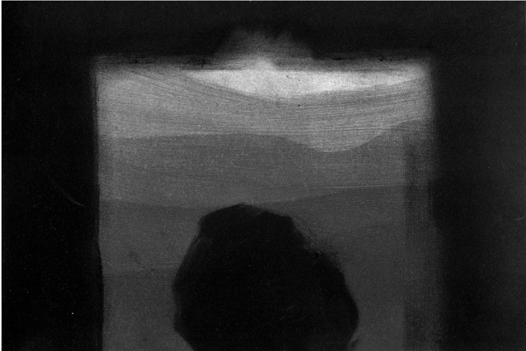
La pierre 1, monotype, 33 x 25 cm, 2015