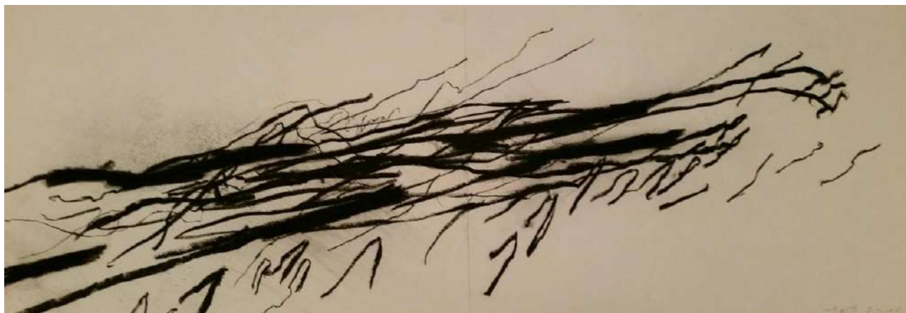
Energie végétale 1, fusain sur papier, 56 x 152 cm, 2017

Une lenteur et le noir est lassé Recherche paysage Paysage de repos, paysage où rêver Noir qui voudrait douceur Voudrait bien toucher ciel Et voudrait s'aérer Noir qui voudrait douceur Et demande pigment Demande pigment au vent Et coule dans sa noirceur Pour disperser dans l'air Son ombre éparpillée