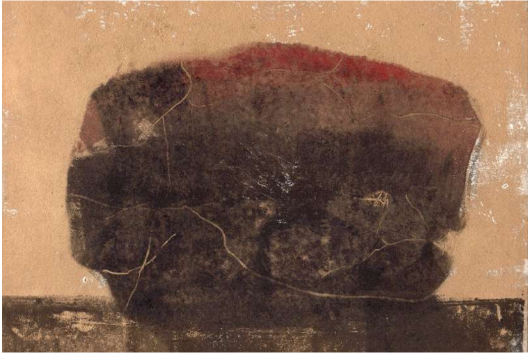
La pierre rouge, monotype, 33 x 25 cm, 2016