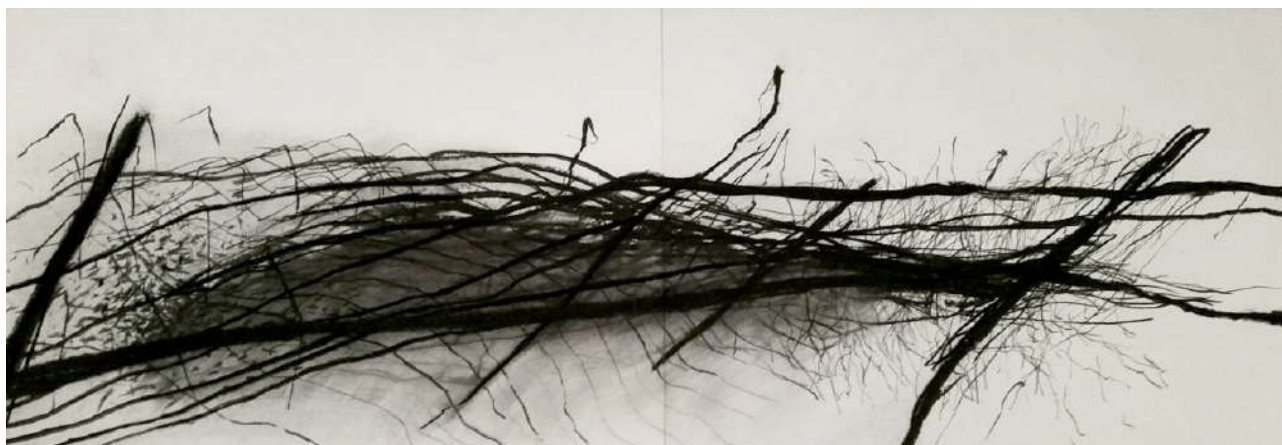
Energie végétale 2, fusain sur papier, 56 x 152 cm, 2017