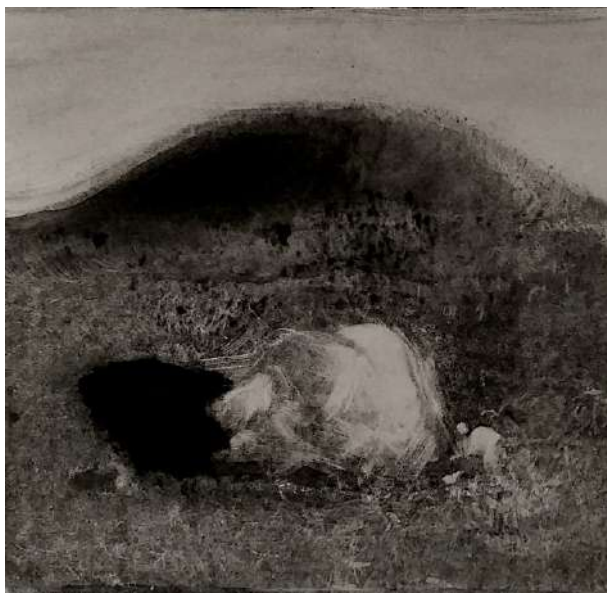
Duo, monotype, 25 x 32 cm, 2014