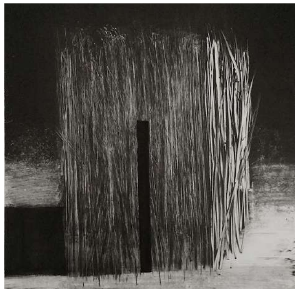
Etroit impossible, monotype, 56 x 76 cm, 2016

« La lumière me donne à voir le monde comme au théâtre » dit Jean-François Baudé. Et pour capter cette lumière Baudé dessine et réalise des monotypes. Le monotype, est un procédé d'impression sans gravure qui produit un tirage unique. Il s'agit de « peindre » avec une encre grasse, sur un support non poreux comme, du métal ou du plexiglas. « La peinture » est ensuite passée sous presse sur un papier spécial qui reçoit l'épreuve, le monotype n'est pas une gravure au sens strict, mais une estampe. L'exposition présentera principalement des monotypes ainsi que des dessins au fusain et aura lieu du 29 mars au 22 avril 2017.