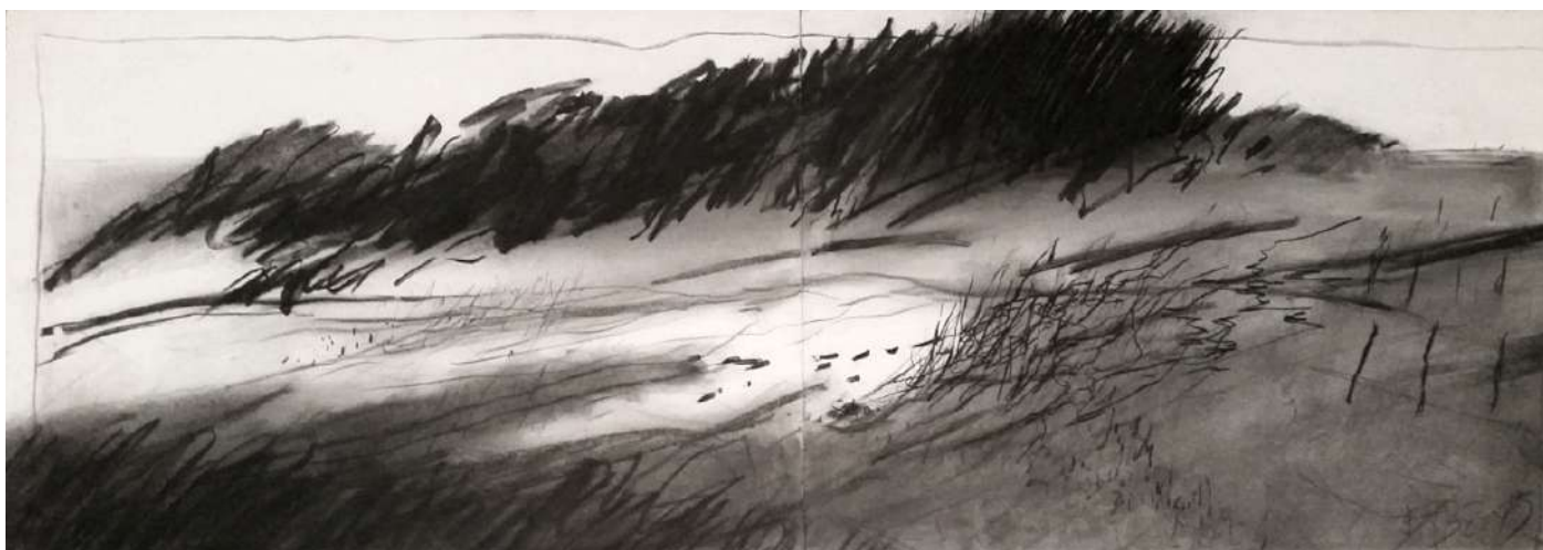
Paysage, fusain sur papier, 56 x 152 cm, 2015