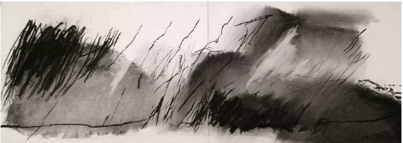
Entre, fusain sur papier, 56 x 152 cm, 2015

Une lenteur et le fantôme du noir Recherche paysage Recherche ventilation Ne veut plus trace du monde Voudrait bien toucher ciel Et voudrait se poser Et cherche aération