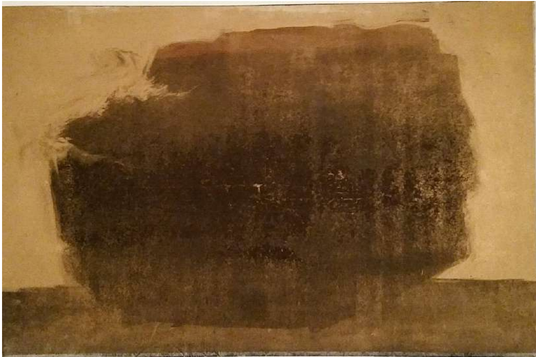
Posée là, monotype, 56 x 76 cm, 2016