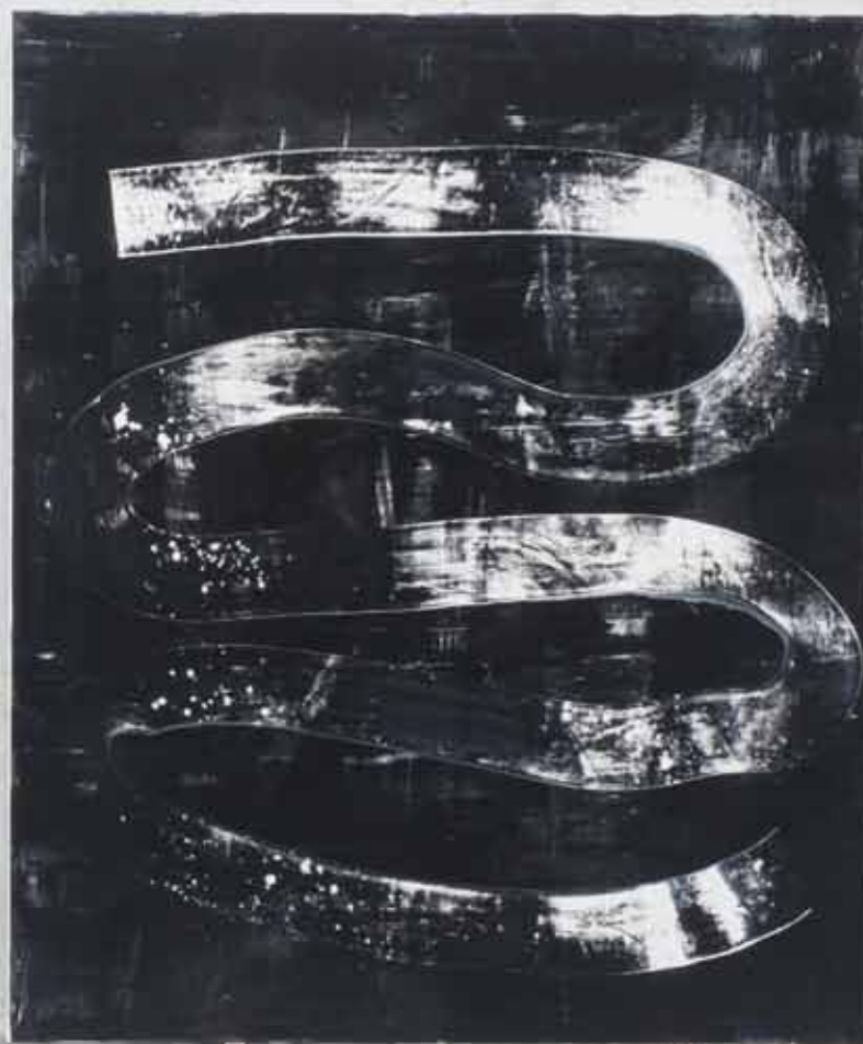
Sans titre . 2011. 180 x150 cm. Huile sur toile.