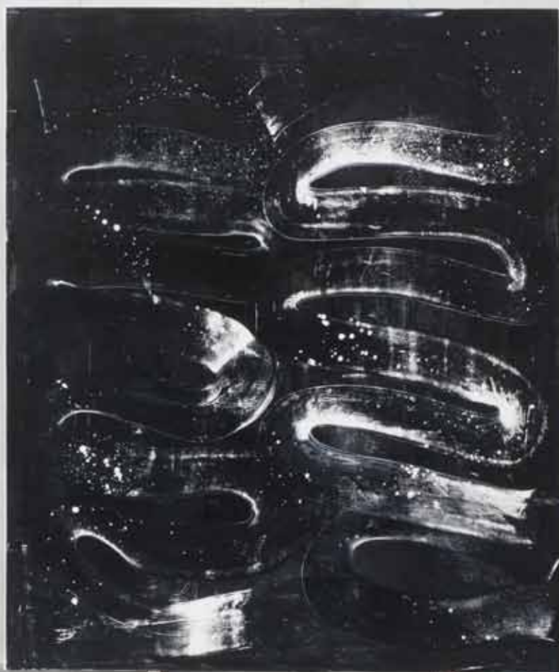
Sans titre . 2011. 180 x150 cm. Huile sur toile.