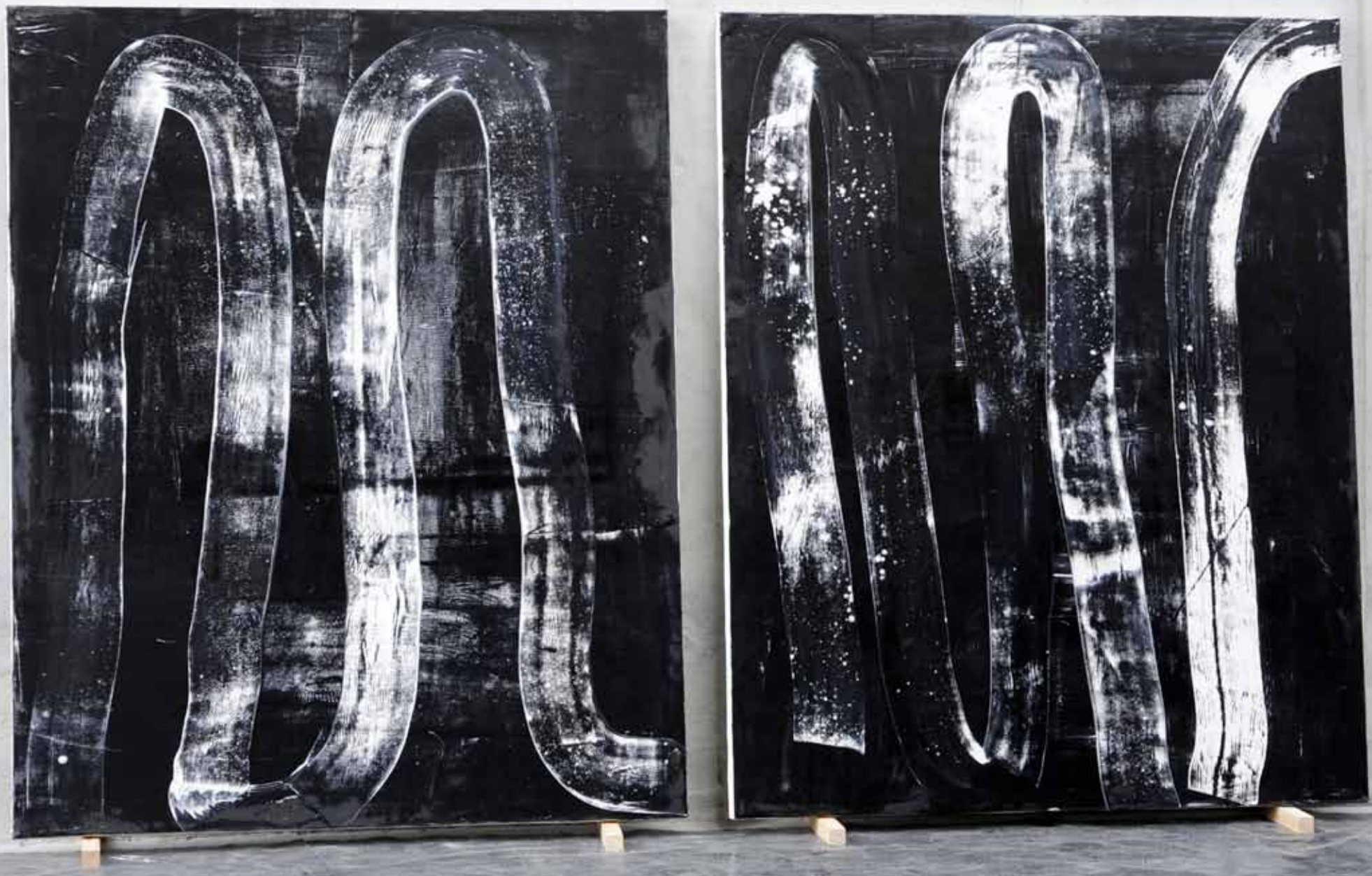
Sans titre . 2011. Dyptique 260 x160 cm. Huile sur toile.