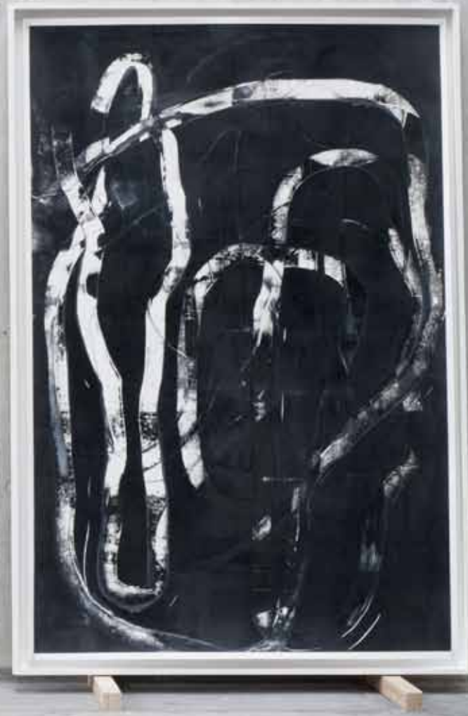
Sans titre . 2011. 120 x 80 cm. Huile sur papier.